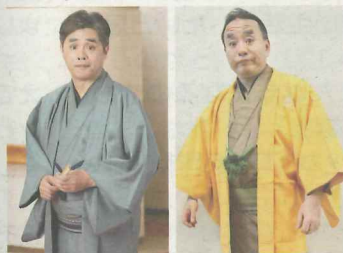
立川志らくさん 立川談慶さん

◆2019初笑い寄席「立川志らく・立川談慶 兄弟会」 1月20日(日)午後3時～、上田市文化センター。入場料＝自由席(優先ゾーン):前売り4000円(当日4500円)、高校生以下3500円(同4000円)。自由席(一般ゾーン):前売り3500円(当日4000円)、高校生以下3000円(同3500円)。未就学児入場不可。問☎090・4462・1999 青木プロダクション。